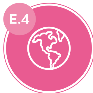
ANTIGUA HACIA EL MUNDO